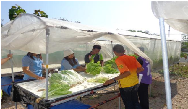
แปลงสาธิตการปลูกผักไฮโดรโปนิกส์