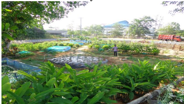
การทำแปลงเกษตรผสมผสาน