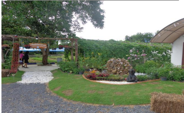
แปลงสาธิตการเกษตร อบต.ควนปริง